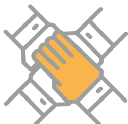
WARSZTATY DLA ZESPOŁÓW