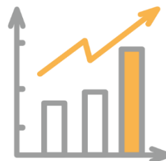
DZIAŁANIA WSPIERAJĄCE ROZWÓJ I FUNKCJONOWANIE ORGANIZACJI