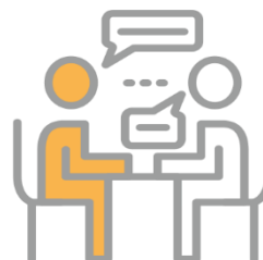
COACHING I KONSULTACJE