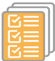
BADANIA, DIAGNOSTYKA, AUDYTY